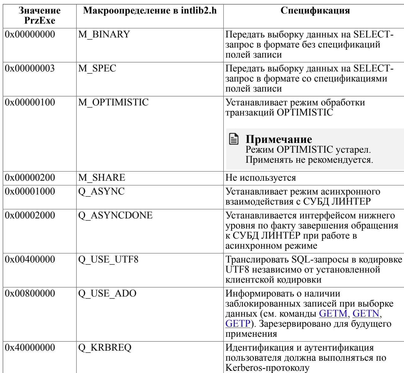
Таблица 2. Возможные значения поля PrzEхе контрольного блока

Если поле PrzEхе не заполнено, устанавливаются следующие параметры канала: